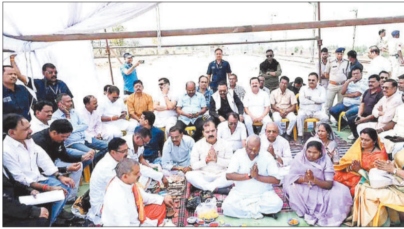
भूमिपूजन करते सांसद सहित अन्य जनप्रतिनिधि।