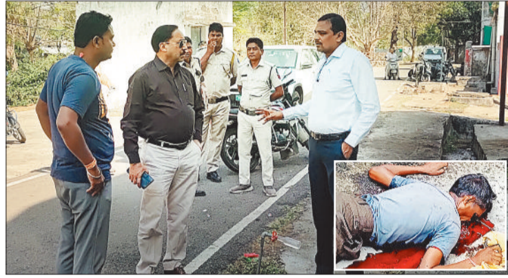
जांच में जुटी पुलिस की टीम। इनसेट में मृतक।