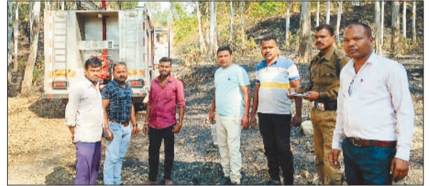
आग बुझाने में शामिल टीम।

कोरिया कॉलरी। क्षेत्र के पोखरी के पास स्थित नर्सरी में शनिवार सुबह असांजिक तत्त्वों द्वारा आग लगा दिए जाने का मामला सामने आया। देखते ही देखते आग ने विकराल रूप धारण कर लिया और आसपास के क्षेत्र में फैलने लगी। आग की लपेट वाउड