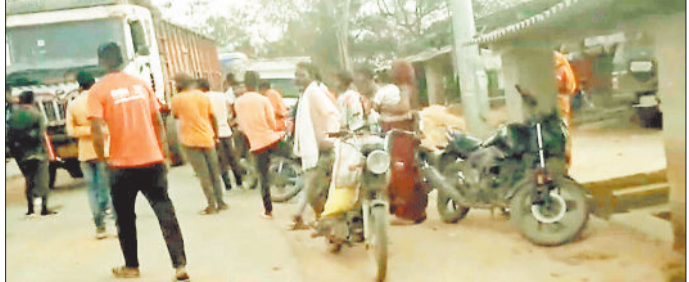
सिंगीटाना तक कुल साढ़े छह किलोमीटर की मजबूत कांक्रिट सड़क का निर्माण कराया जा रहा है जिसकी लागत करीब नौ करोड़ से अधिक की बताई गई है। पूर्व में कच्ची सड़क होने से सड़क की चौड़ाई कम रोका जा रहा है जिससे खदान से कोयला परिवहन बाधित होता है एवं कोयला उठाने में विलम्ब की स्थिति निर्मित हो रही है। खास कर दैनिक प्रबंधन द्वारा अमेरा खदान से

एसईसीएल विश्रामपुर के अमेरा खुली खदान परियोजना से रोड सेल की गाड़ियों को सिंगीटाना और पीपरखर के ग्रामीणों द्वारा विवाद कर घंटों खड़ी करा देने की लगातार शिकायतों के बाद खदान प्रबंधन ने आज शुक्रवार को लखनपुर थाना प्रभारी को पत्र लिखकर आवश्यक कार्यवाही की मांग की है।